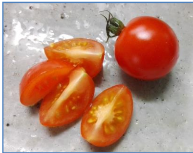
ミニトマトやぶどうは 1/4 にカット