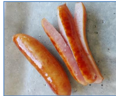
先端が丸い形状をしているのも注意！